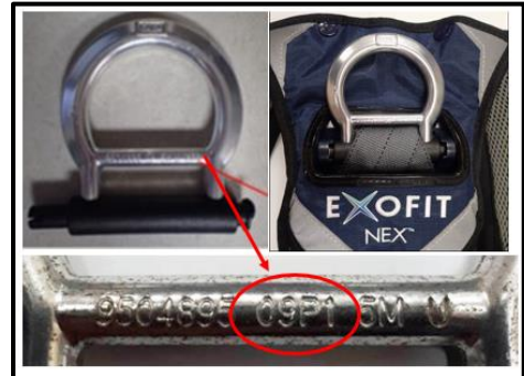
Step 1 Manufacture Date on Harness Shown in Red Circle – must be between 16/01 (2016, January) and 18/12 (2018, December)