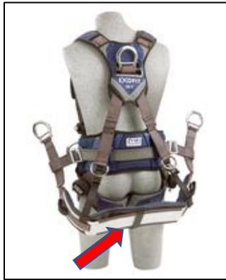
La flecha roja señala la eslinga de asiento del ejemplo

3M Fall Protection ha recibido informes que indican que la placa de refuerzo de aluminio que se usa en la eslinga de asiento puede desprenderse del tejido trenzado en ciertos arneses ExoFit™, ExoFit XP™ (incluyen los modelos para arco eléctrico) y ExoFit NEX™ (incluyen los modelos para arco eléctrico) DBI-SALA. En algunas circunstancias, la placa de asiento de aluminio se ha separado del arnés y se ha caído al suelo, lo que crea el peligro posible de una caída de un objeto. No hemos recibido ningún informe de lesiones o accidentes asociados con esta condición. El desempeño de los arneses no se ve afectado por este problema, por lo que cumplirán correctamente con su propósito en todo momento, hasta como sujeción del cuerpo para un sistema de detención de caídas personal en caso de que se produzca una caída, incluso sin la comodidad adicional que ofrece la eslinga de asiento.